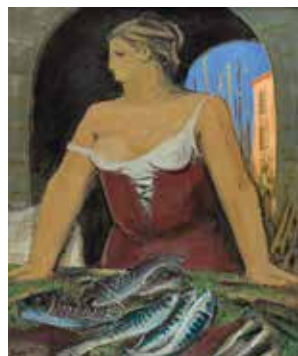
Jean SOUVERBIE (1891-1981) Marchande de poisson à Saint-Tropez Adjugé 16 000 €