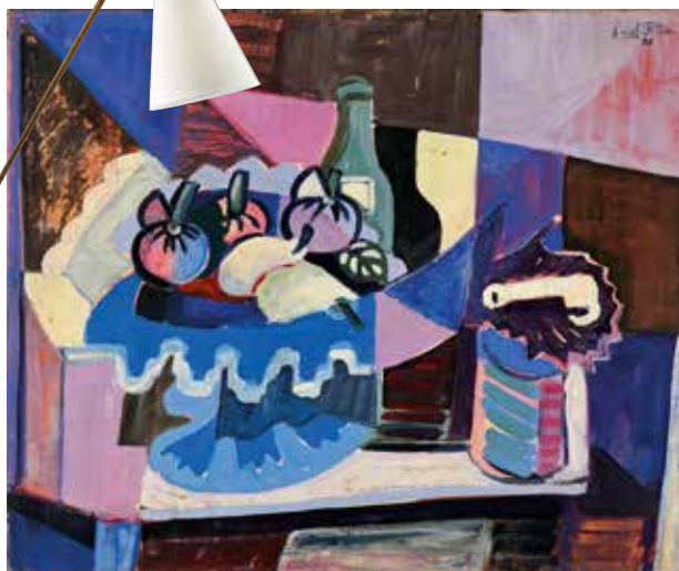
Emil FILLA (1882-1953) Composition cubiste aux fruits et à la bouteille, 1926 Adjugé 39 000 €