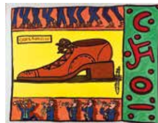
Robert COMBAS (né en 1957) Raoul, 1982 Adjugé 15 000 €