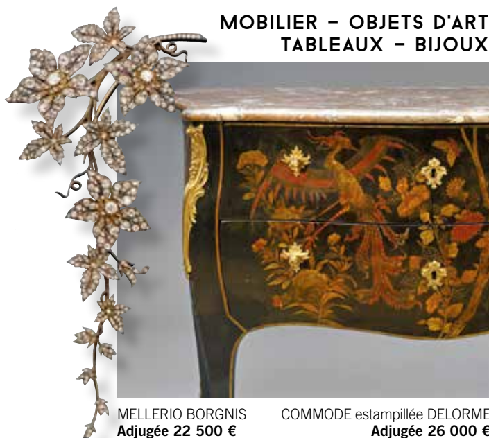
MELLERIO BORGNIS Adjugée 22 500 €