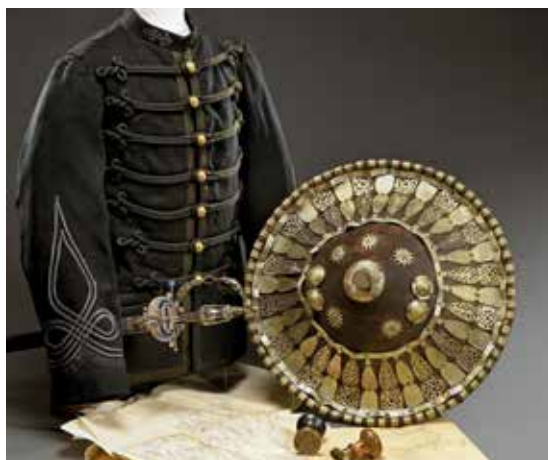
D'un ensemble de souvenirs du Général MARCHAND (héros de Fachoda) - Total des adjudications : 124 000 € 44 préemptions de l'État