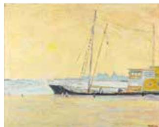
Jacques TRUPHEMUS (né en 1922) Soleil d'hiver sur la Mer du Nord Adjugé 13 500 €